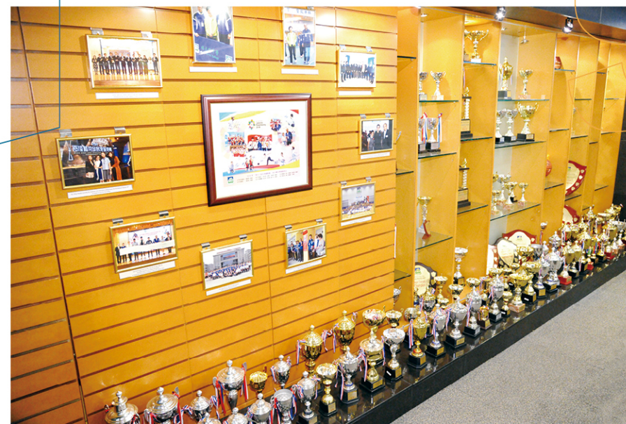
林大輝中學全力支持精英運動員學生，實踐體育與學業雙線發展。