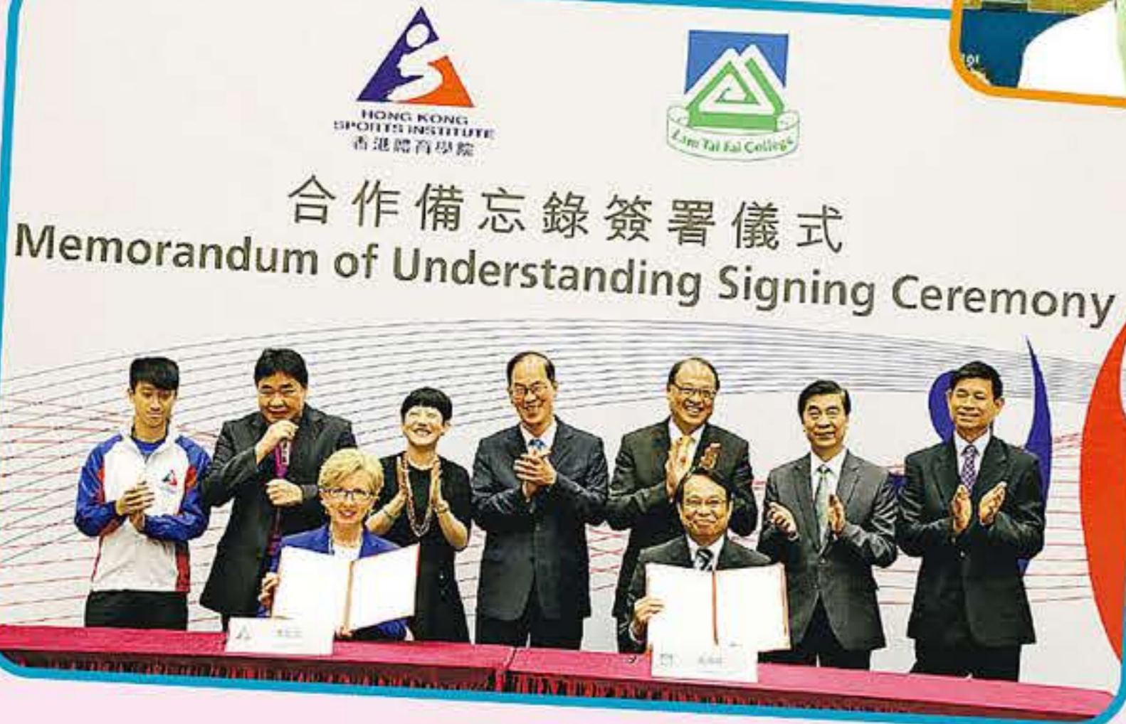
合作備忘錄簽署儀式 Memorandum of Understanding Signing Ceremony